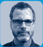
Marcel Hänggi Umweltjournalist und Buchautor